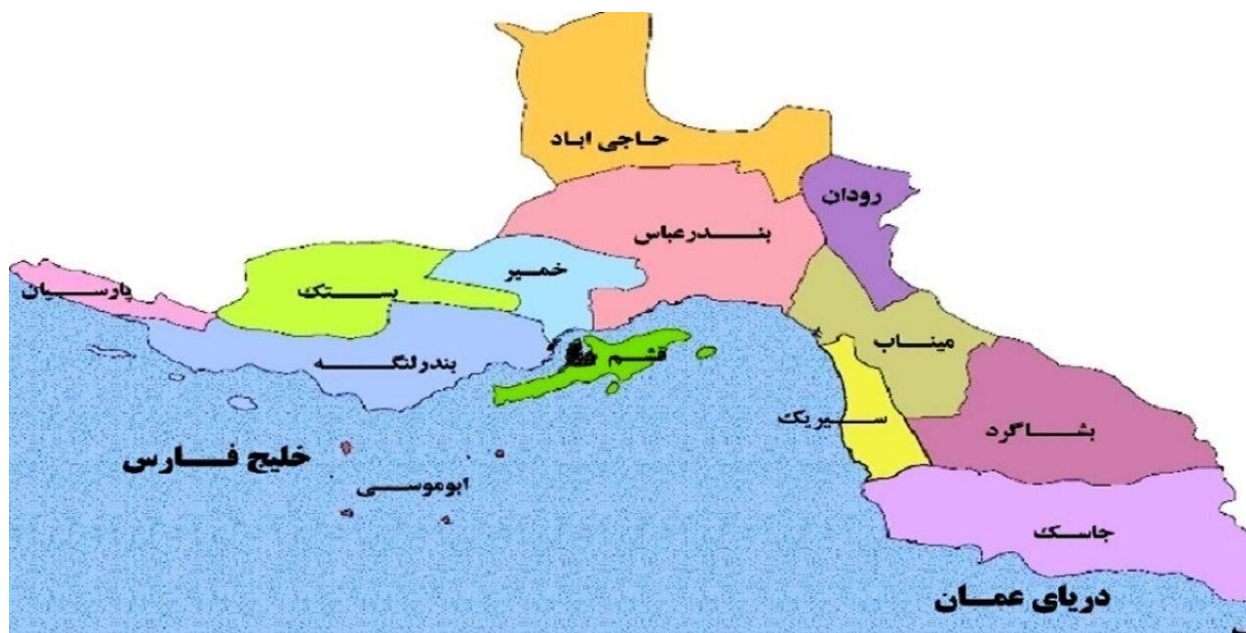
شکل ۲ حوزه انتخابیه استان هرمزگان

شکل ذیل حوزه جغرافیایی انتخابیه مجلس شورای اسلامی استان هرمزگان را نشان می دهد.